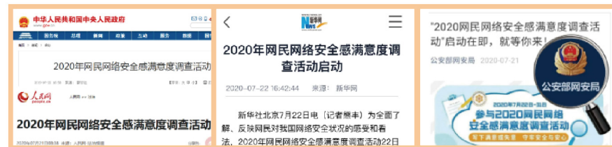
▲ 中国政府网、人民网、新华网、公安部网安局等权威媒体报道

第三届网民网络安全感满意度调查活动借鉴前两年的经验，组委会多措并举广泛宣发，得到各地政府部门、企事业单位、媒体、学校、社区等社会各界的支持参与，最终共采集150万份有效问卷，是上一年的6.81倍。