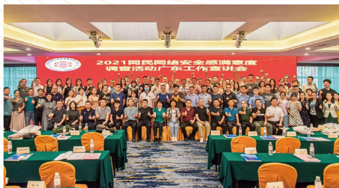
▲ 2021网民网络安全感满意度调查活动广东宣讲会

第四届展开新的探索并取得巨大成功。调查活动同心圆越画越大，在全国首次举办了线上线下相结合的调查报告发布周，多维度多层次推进网民网安调查，总结出全民参与、全民发声、全民受益的调查之路，凝聚全社会的共识与合力，与亿万网民同心而行，与国家网络安全同向而进。