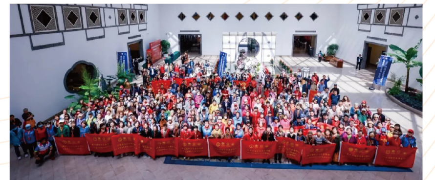
▲ 香山志愿队伍大合照

在全党全国上下全面贯彻党的二十大精神和践行“大兴调查研究之风”的大背景下，调查活动启动了第二个五年计划（2023年-2027年），各地网民踊跃参与，活动覆盖面更广也更细，20个省（自治区、直辖市）区域网民参与答题总样本量破万份，其中广东、辽宁、新疆、河南、云南、黑龙江突破10万份，志愿服务团队成为了深入一线采集样本的主力军。