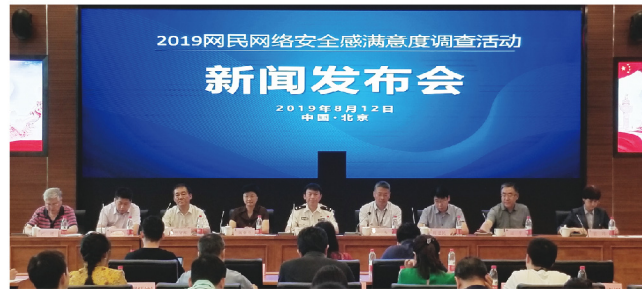
▲ 2019年调查活动新闻发布会在京举办

网民网络安全感满意度调查活动发展到第二届，发起单位由85家增至135家，共采集22多万份有效问卷。调查活动得到上级的高度重视，公安部网络安全保卫局及全国各级公安网安部门成为调查活动指导单位，并首次推出全国网民网络安全感满意度指数。