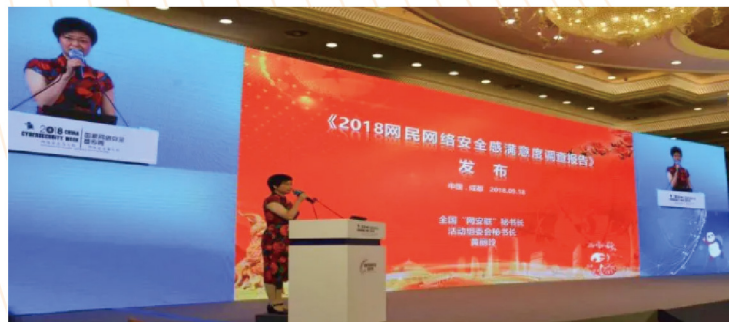
▲ 首届网民网络安全感满意度调查全国总报告发布会现场

首届网民网络安全感满意度调查活动，由全国85家网安联成员单位共同发起，活动得到全国各地网民热烈响应，共采集到14多万份有效问卷，入选当年网络安全十件大事。