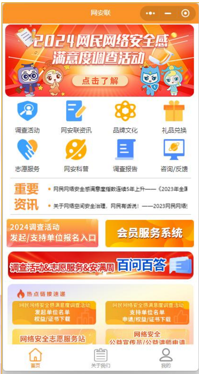
▲升级后~2024样本采集前